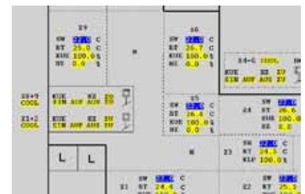
Ausschnitt aus einem Etagen-Grundriss mit Anzeige von Zonen-Temperaturen und Klappenstellungen.

Ansteuerung von Brandschutzklappen (BSK) eingesetzt werden. Gemäss der VKF Richtlinie sind die Brandschutzklappen ein Bestandteil der Lüftungsanlage, werden nicht als eigenes Gewerk betrachtet und sind deshalb in die gleiche Automationsanlage eingebunden. Weitere Auflagen an die Steuersysteme bestehen zurzeit keine in der Schweiz. Die VKF-Richtlinien schreiben also keinen speziellen „Sicherheitsbus“ für Brandschutzklappen vor! Die Sicherheitsfunktion, d.h. Schliessen der BSK muss sichergestellt sein. Bei einer Bus-Steuerung muss dies durch „Heartbeats“ der Sendermodule und Receive-Timeouts in den Empfangsmodulen sichergestellt werden. Die kommunikative Bus-Steuerung ist sicher die zeitgemässe Steuerungsart. Sie erhöht die Funktionalität, Sicherheit, reduziert den Installationsaufwand und vermindert die Brandlasten beträchtlich. Im Projekt UBS Flurhof werden BKN230-24LON, LONWORKS®-Kommunikations- und Netzgeräte für Top-Line Brandschutzantriebe eingesetzt. Das BKN230-24LON ergänzt die im Antrieb integrierten Sicherheitsfunktionen und übersetzt das digitale MP-Protokoll vom Antrieb auf LonTalk® und umgekehrt. Das BKN230-24LON ist LonMark® zertifiziert und stellt sämtliche Funktionen der Top-Line Brandschutzantriebe dem LonWorks® Netzwerk als Standard-Netzwerkvariablen (SNVT) zur Verfügung. Es sind die Objekte „Node“, „FSDA“