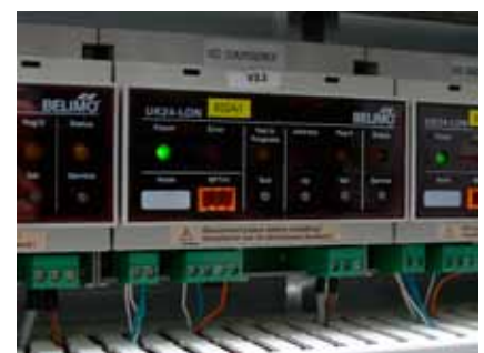
UK24LON-Geräte in der Lüftungszentrale, welche die Volumenstromregler mit MP-Bus und LON verbinden..

Über LON FTT 10 und Loytec-Router werden mit Honeywell Kühldeckenregler einerseits die Ventile der Kühldecken geregelt. Die eingesetzten W7763 Kühldeckenregler entsprechen dem LonMark Funktionsprofil #8020 «Fan Coil Unit Controller», Version 2.0. Andererseits gibt der Temperaturregler den VAV Compactreglern NMV-D2M von Belimo, welche jederzeit das gewünschte Volumen zur Verfügung stellen, via MP/LonWorks Gateway